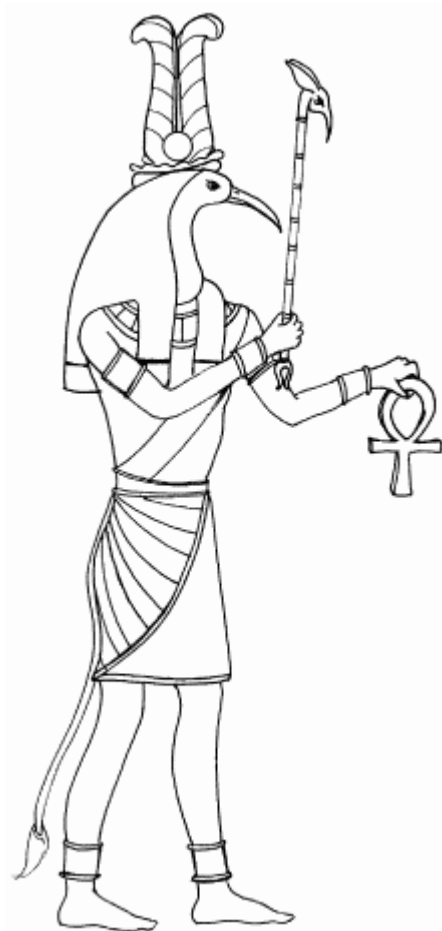
БОЖЕСТВЕННАЯ ФОРМА ТОТА

На Границе Ночи, у Предела Света – стоял Тот До появления Нерожденного Времени! Потом образовалась Вселенная Потом явились Боги Из Эонов Нерожденной Бесконечности Потом прозвучал Голос Потом было названо Имя. На Границе, у Врат Между Вселенной и Бесконечностью В Знаке Входящего стоял Тот, А перед ним рождались Эоны. Дыханием он их озвучил, Знаками – записал их, Ибо стоял он меж Светом и Тьмой.